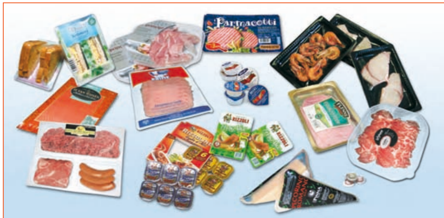
PRINTED IN ITALY - VALASSORA - VIGEVANO

Ci riserviamo il diritto di migliorare il ns. macchinario senza avviso / We reserve the rights to technically improve our equipment without notice / Dans le cadre d'amélioration techniques, nous nous réservons le droit d'apporter toute modification que nous jugerions nécessaire, sans avertissement au préalable / Nos reservamos el derecho de mejorar técnicamente nuestra maquinaria sin previo aviso.